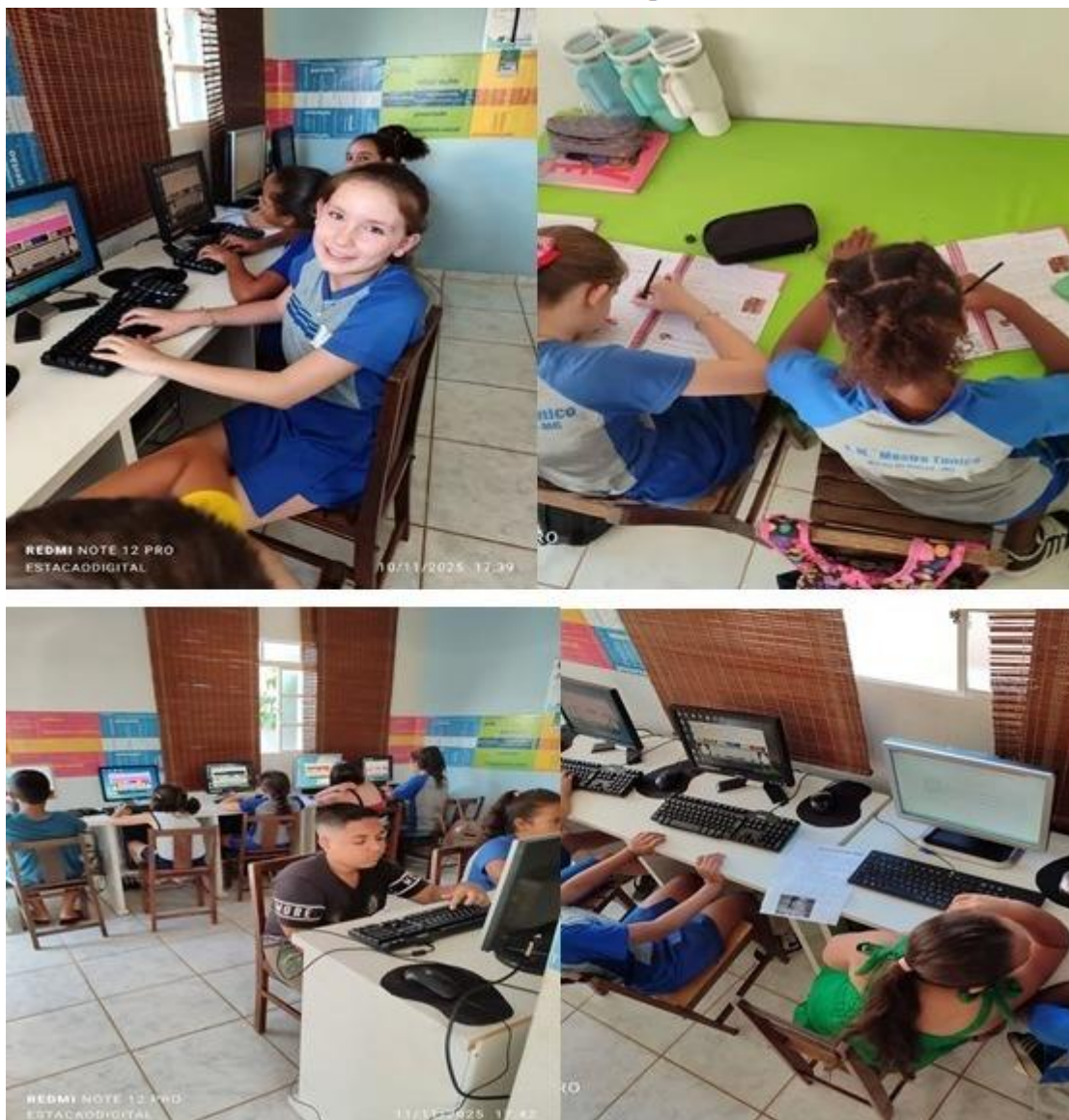
Imagem 33 – 10 a 11/11/2025. Atividades no espaço digital – construção de laços afetivos e memórias. Estação Digital – Dores do Indaiá/MG.