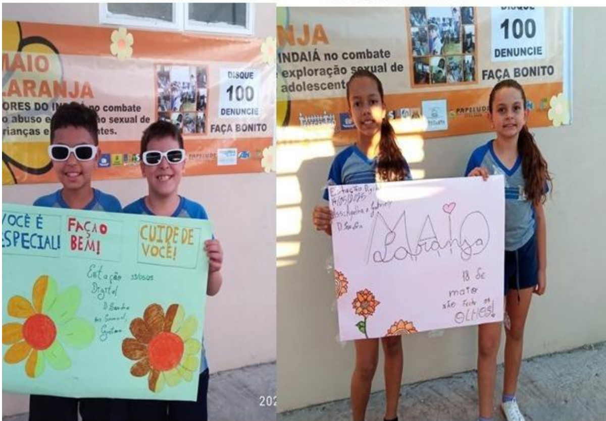
Imagem 14 – 17/05/2025. Maio Laranja – campanha de proteção contra abuso infantil. Estação Digital – Dolores do Indaiá/MG.