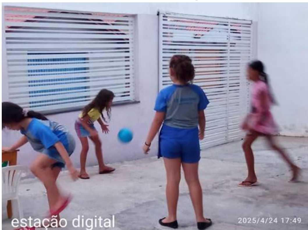
Imagem 11 – 25/04/2025. O brincar e o desenvolvimento integral das crianças. Estação Digital – Dolores do Indaiá/MG.