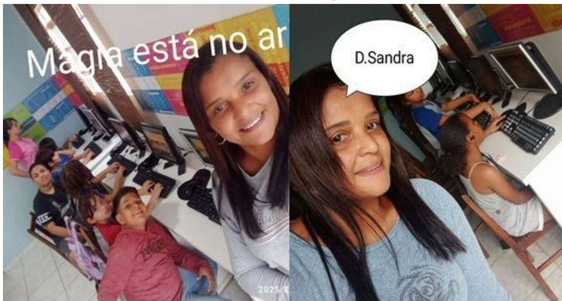
Imagem 21 – 05/08/2025. Fortalecimento de vínculos familiares – visita às famílias. Estação Digital – Dores do Indaiá/MG.