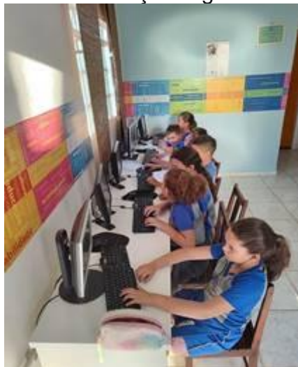
Imagem 22 – 13/08/2025. Ditado, digitação, Português, Informática, cidadania e brincadeiras. Estação Digital – Dores do Indaiá/MG.