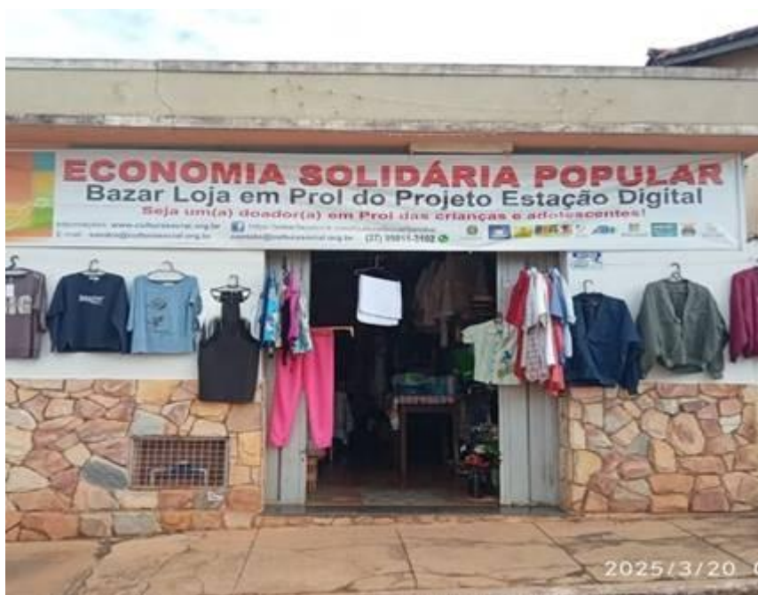
Imagem 03 - Fachada do Bazar solidário 15. RESULTADOS ALCANÇADOS