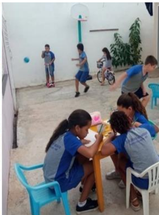
Imagem 01 – Início das atividades de 2025 na Estação Digital.