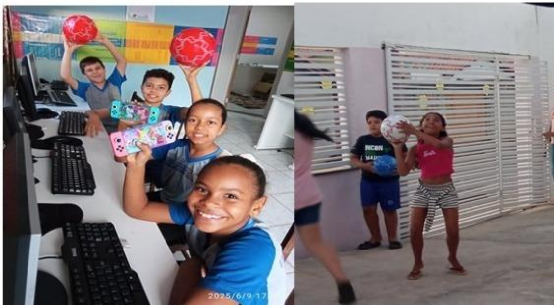
Imagem 18 – 10/06/2025. Doação de brinquedos para as crianças da Estação Digital.