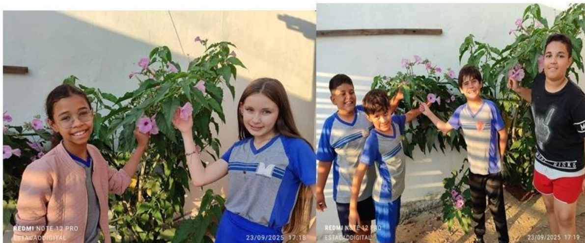
Imagem 28 – Setembro/2025. Primavera – pesquisas sobre flores, confecção de cartazes e apreciação do meio ambiente. Estação Digital – Dores do Indaiá/MG.