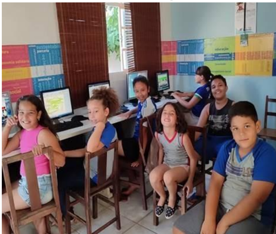
Imagem 31 – 06/11/2025. Atividades no computador, interações e brincadeiras. Estação Digital – Dolores do Indaiá/MG.