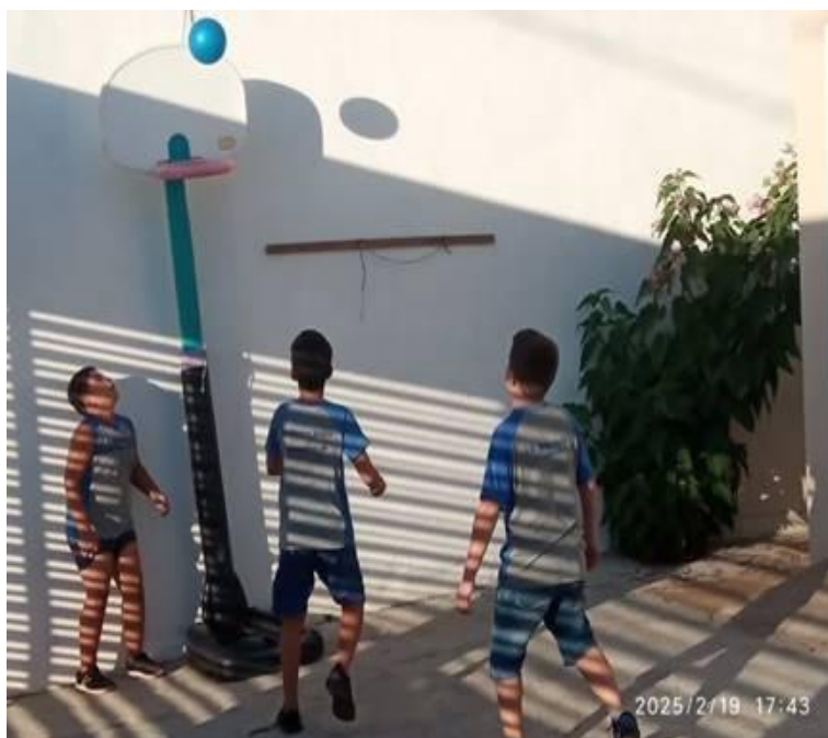
Imagem 03 – Esporte, saúde e vida. Estação Digital – 10 anos. Santa Cruz, Dolores do Indaiá/MG. 17/02/2025.