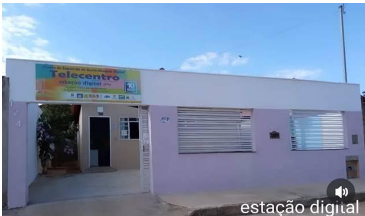
Imagem 01 - Fachada Estação Digital 13. ABRANGÊNCIA TERRITORIAL E PARCERIAS

Território: Município de Dores do Indaiá/MG, com prioridade para o Bairro Residencial Santa Cruz e adjacências.