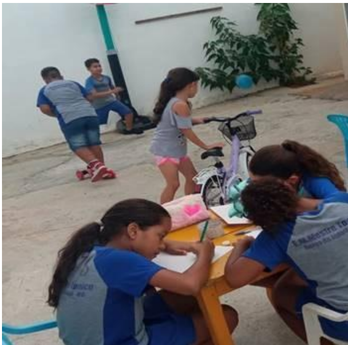
Imagem 09 – 31/03/2025. Desenho ao ar livre, brincadeiras, arte e esporte. Estação Digital – Dolores do Indaiá/MG.