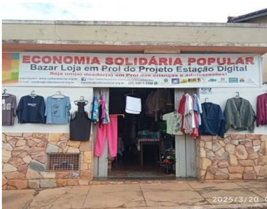
Imagem 05 – 20/03/2025. Bazar Estação Digital – Economia Solidária. Rua Aimorés, 397 – Bairro São, Dolores do Indaiá/MG. Manhã. (37) 99811-3102.