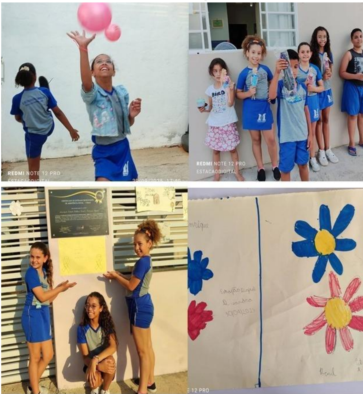
Imagem 30 – 12/10/2025. Feliz Dia das Crianças! – Bairro Residencial Santa Cruz, Estação Digital – Dores do Indaiá/MG.