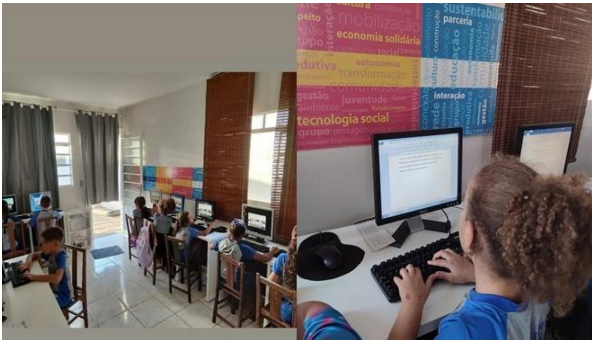
Imagem 23 – 25/08/2025. Crianças de 6 a 10 anos: digitação, criação de histórias, jogos educacionais e atividades lúdicas interdisciplinares (Português, Matemática, Arte, Ciências, Geografia, História, Educação Física). Fortalecimento de vínculos. Estação Digital – Dolores do Indaiá/MG.