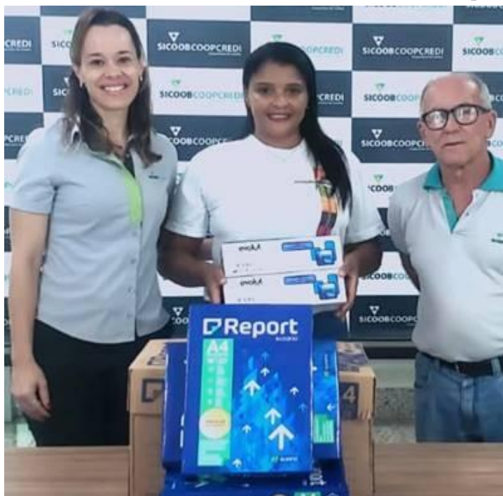
Imagem 02 - Entrega insumos pelo SICOOB para matrículas na Estação Digital.