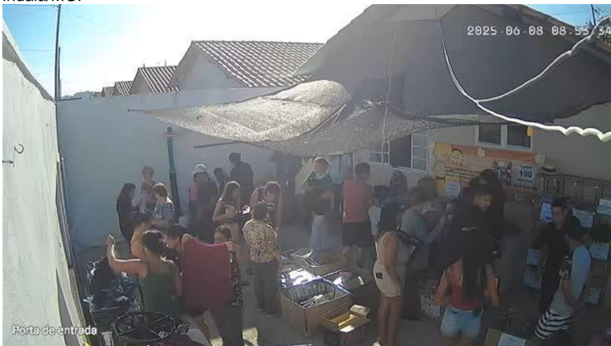
Imagem 17 – Bazar – produtos doados de mercadorias apreendidas pela Receita Federal.