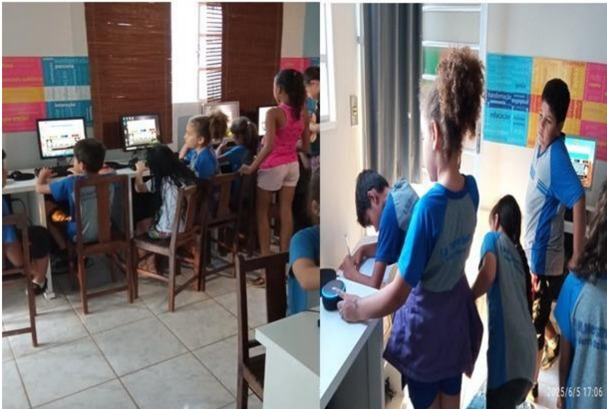
Imagem 16 – 05/06/2025. Presença e brincadeiras. Estação Digital – Dolores do Indaiá/MG.