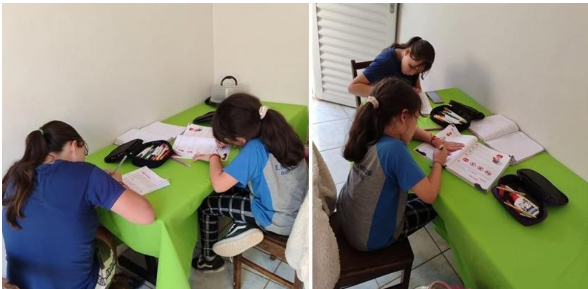
Imagem 25 – 10/09/2025. Dever de escola e ditado no computador. Centro de Convivência e Fortalecimento de Vínculos. Estação Digital – Dolores do Indaiá/MG.