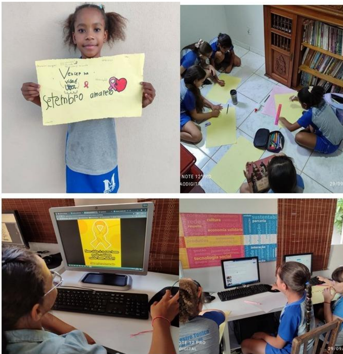
Imagem 29 – 29/09/2025. Setembro Amarelo – mês de prevenção ao suicídio. Crianças de 8 e 9 anos pesquisaram frases de apoio e confeccionaram cartazes sobre o tema. Diálogo sobre a importância da vida, apoio e acompanhamento profissional. Disque 188. Estação Digital – Dolores do Indaiá/MG.