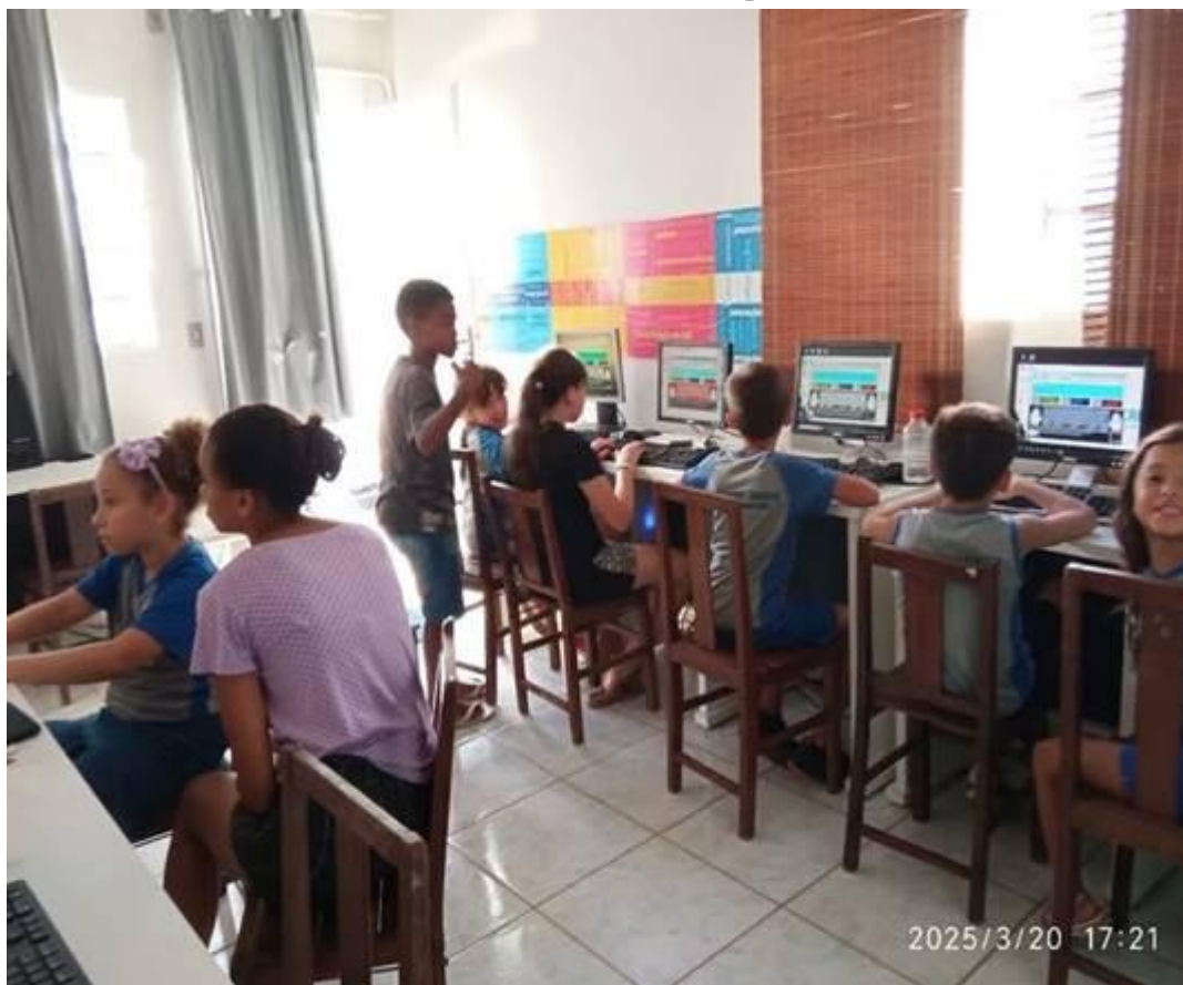
Imagem 07 – 20/03/2025. Programação da Estação Digital: Robótica (6-10 anos), Informática com certificados ATN (+11 anos), Educação para a Vida, pesquisas escolares e esportes. Dolores do Indaiá/MG