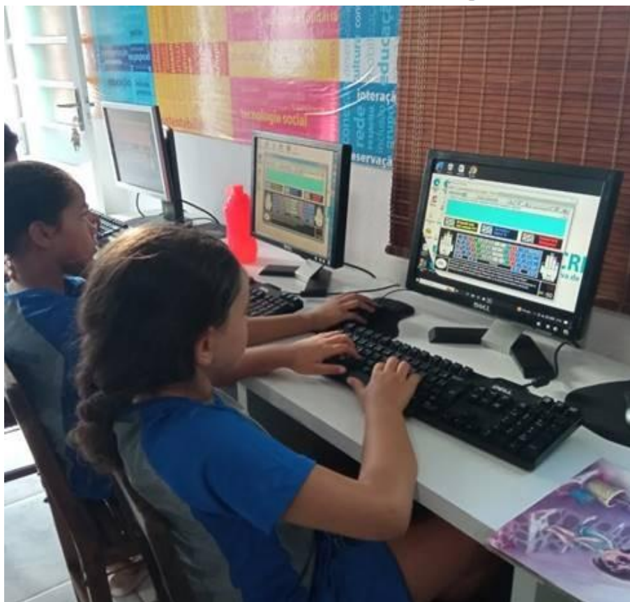
Imagem 06 – 12/03/2025. Informática básica: desenho livre e pesquisas temáticas. Estação Digital – Dores do Indaiá/MG.