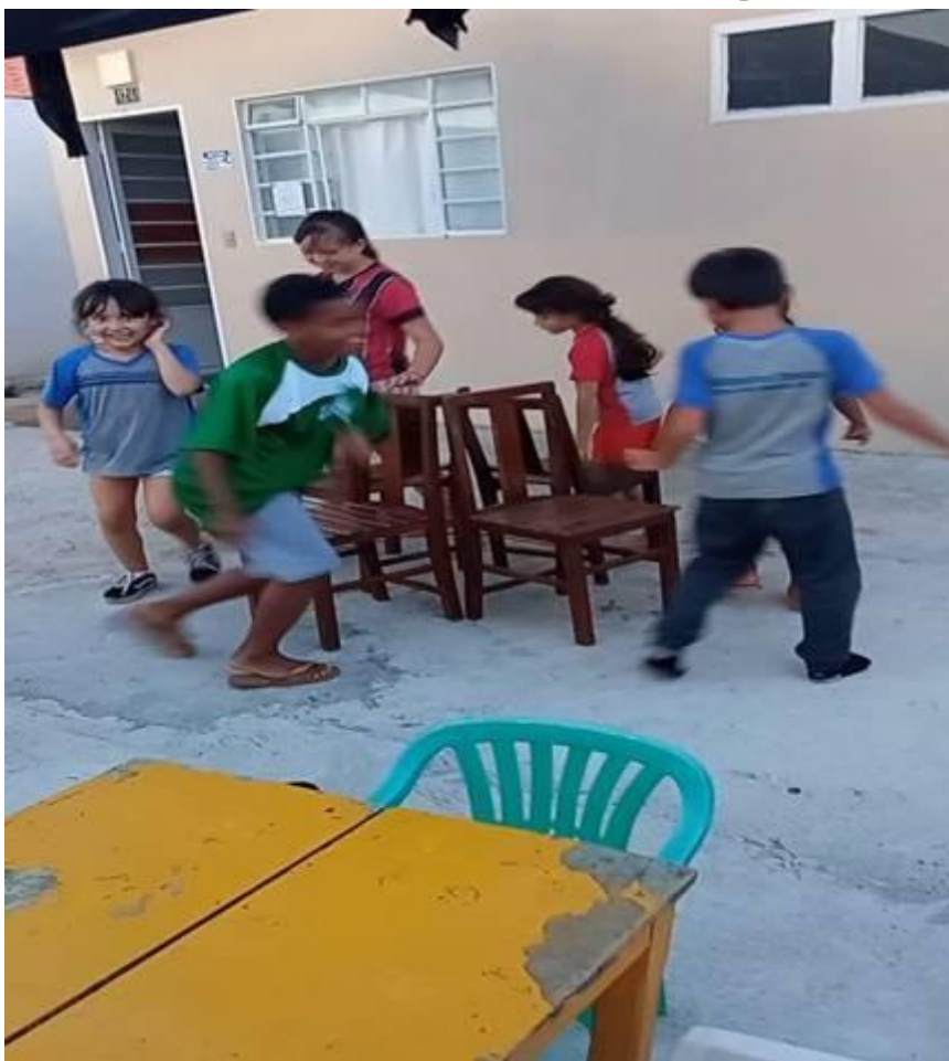
Imagem 08 – 25/03/2025. Brincadeira: Dança das Cadeiras. Estação Cultura Social e Inclusão Digital – MG. Link: https://www.facebook.com/CulturaSocialSandra?locale=pt_BR