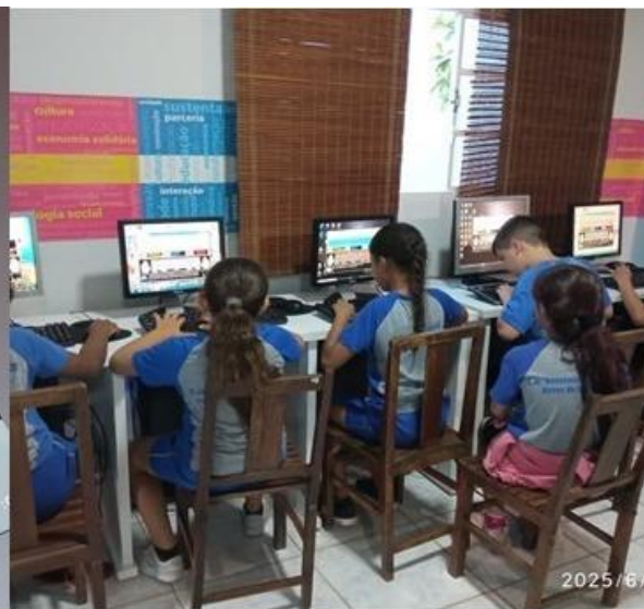
Imagem 19 – 23 a 26/06/2025. Robótica, digitação, ditado no Word (Wi-Fi), brincadeiras. Interdisciplinaridade: Português, Informática e Esportes. Estação Digital – Santa Cruz, Dores do Indaiá/MG.