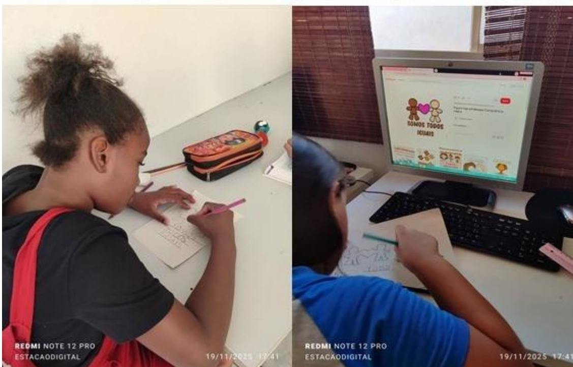
Imagem 34 – 20/11/2025. Dia da Consciência Negra – atividades com as crianças. Estação Digital – Dolores do Indaiá/MG.