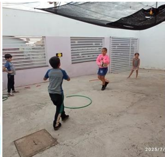
Imagem 20 – 18/07/2025. Bom recesso! Estação Digital – Dores do Indaiá/MG.