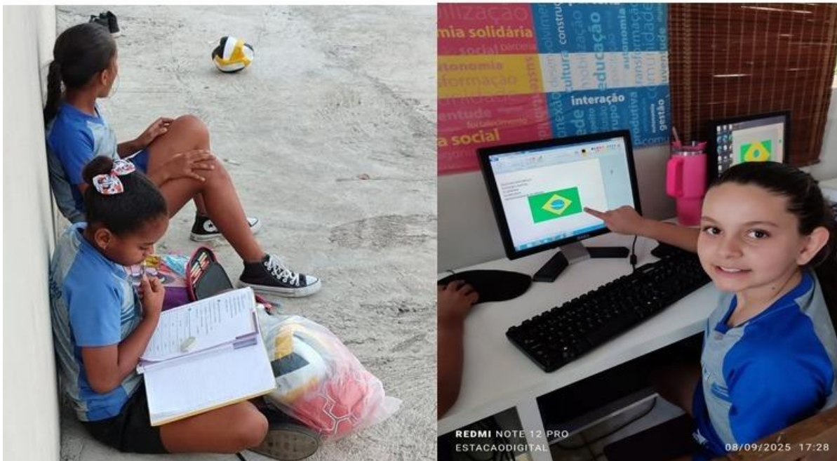
Imagem 24 – 08/09/2025. Independência do Brasil – Hino Nacional e desenho da Bandeira no Paint. Estação Digital – Dolores do Indaiá/MG.