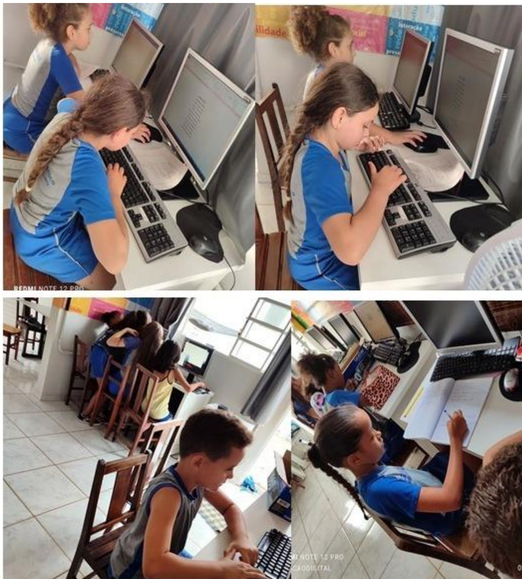
Imagem 35 – Dezembro/2025. Ações do mês: criações, edições e formatações de textos. Estação Digital – Dores do Indaiá/MG.