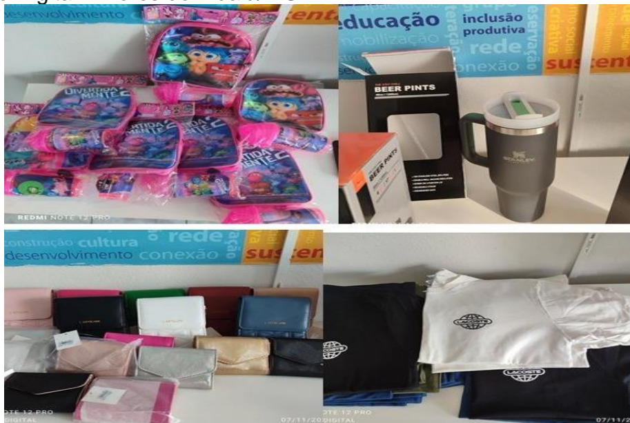
Imagem 32 – 07/11/2025. Bazar Estação Digital – Mercadorias apreendidas pela Receita Federal e doadas. Óculos (R$30), blusas Lacoste (R$30), merendeira infantil com copo (R$25), carteiras, bolsas, mochilas adulto, caixa de som. Vendas pelo WhatsApp (37) 99811-3102. Dolores do Indaiá/MG.