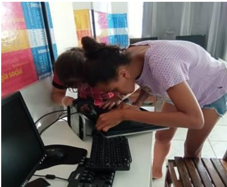
Imagem 04 – 11/03/2025. Montagem de computador com adolescentes. Estação Digital – Dolores do Indaiá/MG.